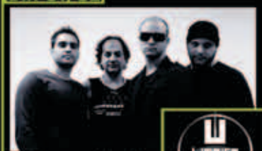
U2 Cover - Limeira