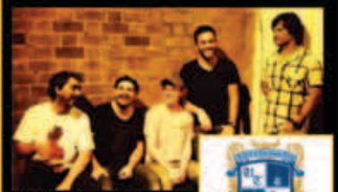
U tell & The Skool Bang