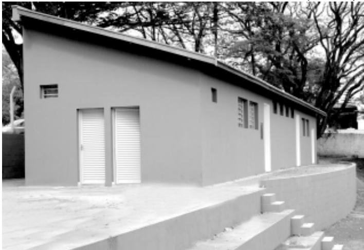
Novos vestiários instalados ao lado do campo

Bairro do Cascalho, em Cordeirópolis, recebeu melhorias no seu campo de futebol. O local conta agora com uma arquibancada de alvenaria, um amplo vestiário e até mesmo um quiosque para os