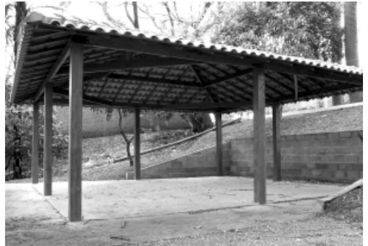
Quiosque construído já está pronto para uso

jogadores se reunirem após os jogos. No recinto também foram feitas melhorias nos acessos como a implantação de portões maiores e no sistema da rede esgoto. Além disso, sobre as arquibancadas foi