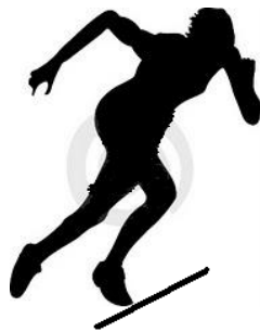
A – 2