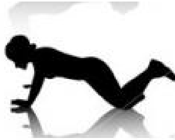
A - 4