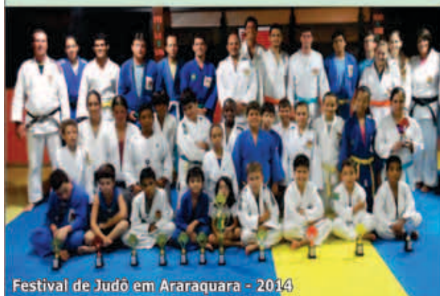
Festival de Judô em Araraquara - 2014

CORDEIRÓPOLIS Desenvolvimento com Responsabilidade