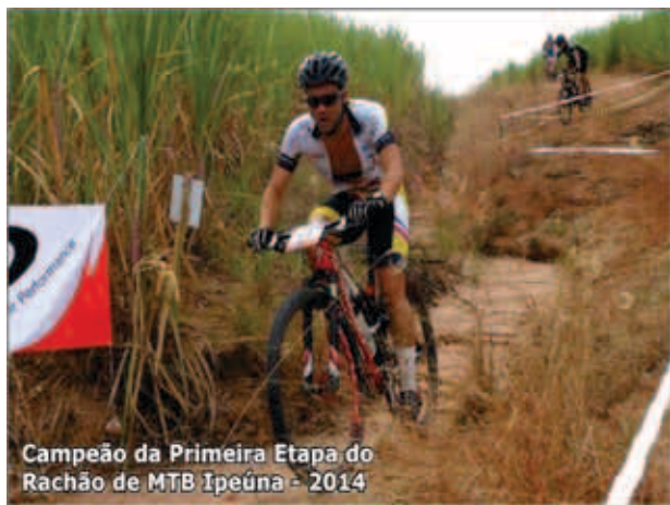
Campeão da Primeira Etapa do Rachão de MTB Ipeúna - 2014