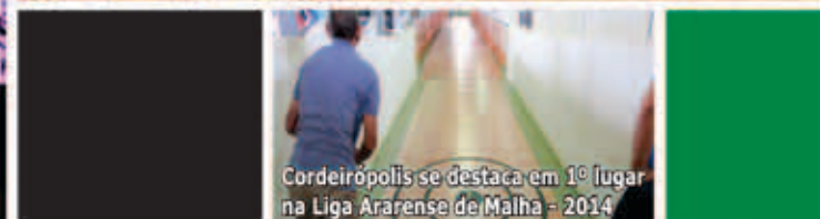
Cordeirópolis se destaca em 1º lugar na Liga Ararense de Malha - 2014