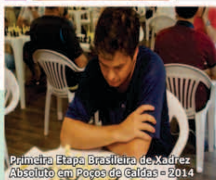
Primeira Etapa Brasileira de Xadrez Absoluto em Poços de Caldas - 2014