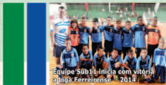
Equipe Sub11 inicia com vitória a Liga Ferreirense - 2014