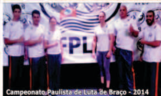
Campeonato Paulista de Luta de Braço - 2014