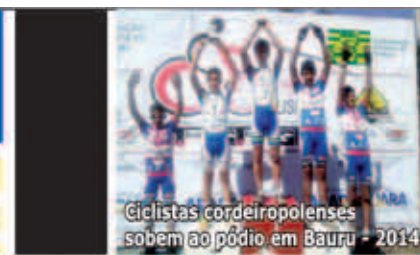
Ciclistas cordeiro-polenses sobem ao pódio em Bauru - 2014