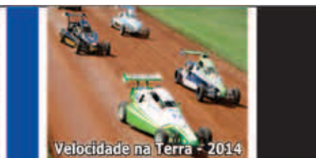
Velocidade na Terra - 2014