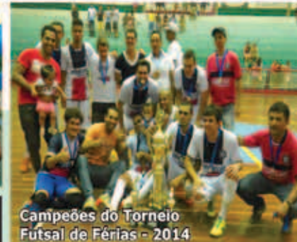
Campeões do Torneio Futsal de Férias - 2014