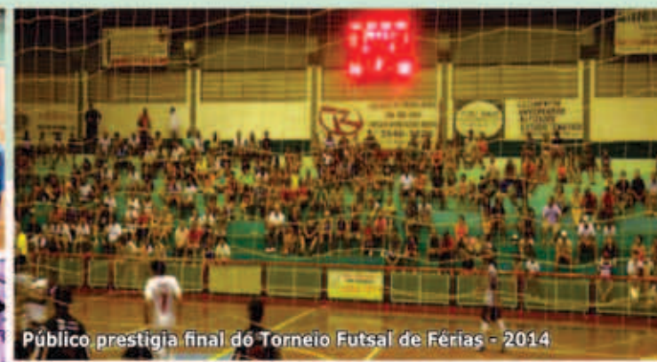
Público prestigia final do Torneio Futsal de Férias - 2014