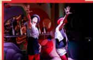
COLAS SHOW RIBEIRÃO PRETO/SP