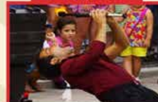
MOMENTOS DE LIBERDADE URUGUAI

LOCAL: PRAÇA JAMIL ABRAHÃO SAAD CENTRO, CORDEIRÓPOLIS SP