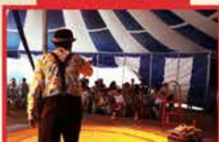
ZÉ GAMBIARRA E CIA FULÔ UBATUBA/SP