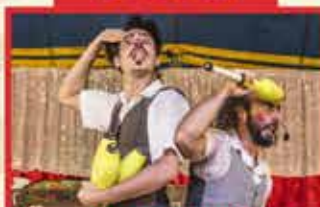
CIRCO DE DOISDO E CIA PÉ DE CANA IRACEMÁPOLIS/SP