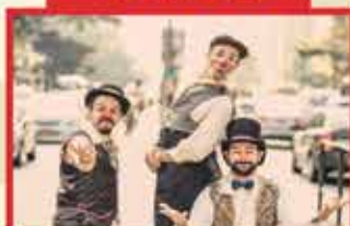
TRUQUES E TRAMBIQUES SÃO PAULO/SP