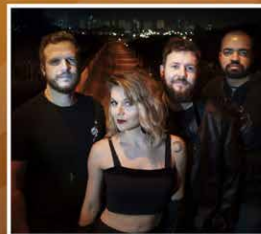
Especial Sandy & Junior BANDA PANDEMYA

LOCAL : PRAÇA "COMENDADOR JAMIL ABRAHÃO SAAD"