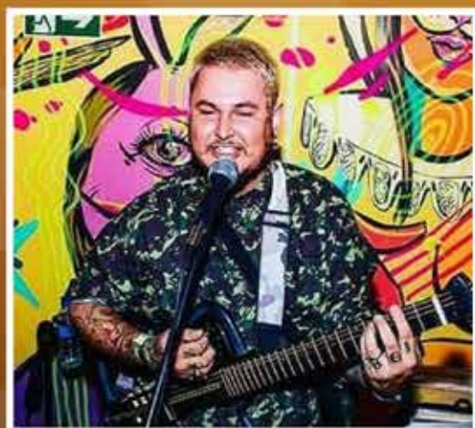
DOM KONE SOM DE PRAIA