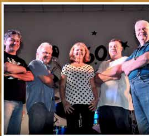
Banda SURFÊNIX Jovem Guarda