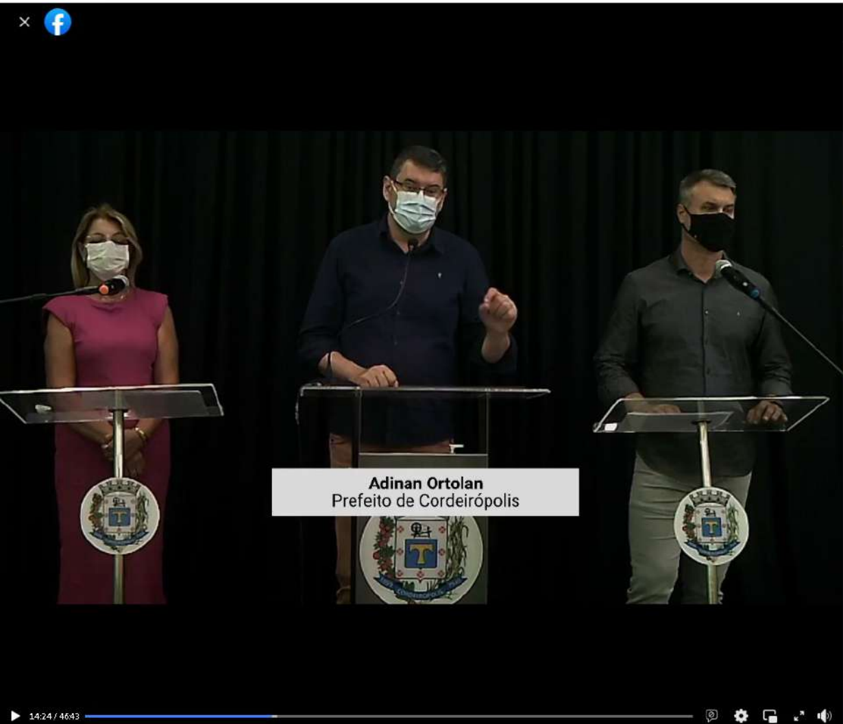
Adinan Ortolan Prefeito de Cordeirópolis